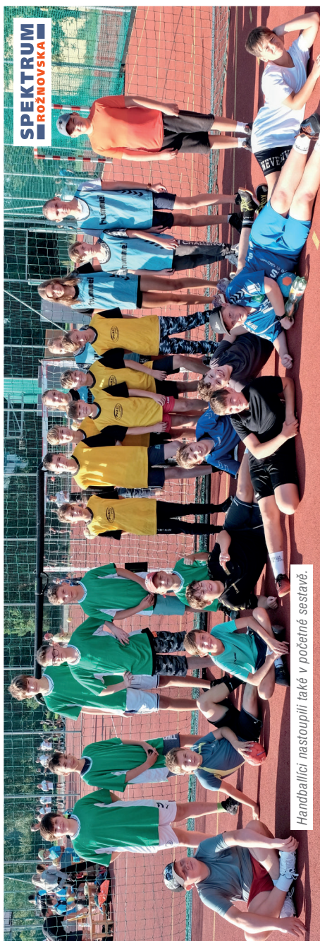
Handbalisti nastoupili také v počtné sestavě.

Softhandball je v Rožnově vytvořené odvětví házené, které vzniklo z házené 4+1 pro nejmenší miniházenkáře. „My jsme propagátoři tohoto zábavného druhu házené, jenž se hraje s upravenými pravidly házené na malém hřišti bez drblinky s pěnovým míčem, a rozšířil ho na všechny věkové kategorie. No, a tak se na hrací ploše sešli nejmenší házenkáři se svými rodiči a hráli kluci a holky společně se staršími kamarády ze školy, kteří házenou hrají jen ve škole v rámci tělocviku. Raritou