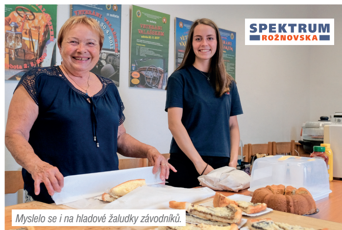
Myslelo se i na hladové žaludky závodníků.