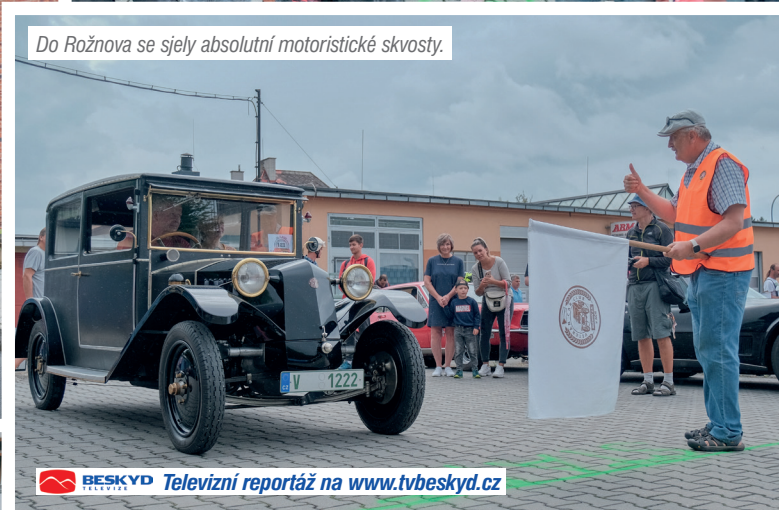
Do Rožnova se sjely absolutní motoristické skvosty.

BESKYD Televizní reportáž na www.tvbeskyd.cz