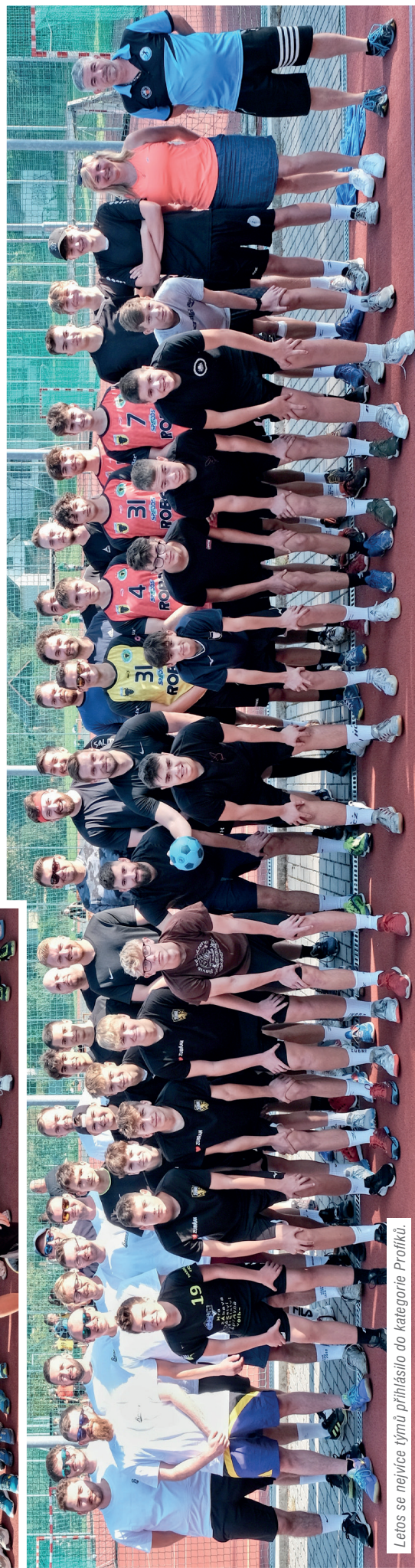
Letos se nejvíce týmů přihlásilo do kategorie Profiků.