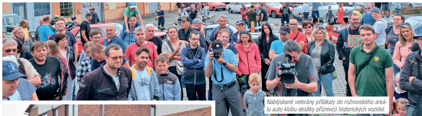
Nablýskané veterány přilákaly do rožnovského areálu auto klubu desítky příznivců historických vozidel.