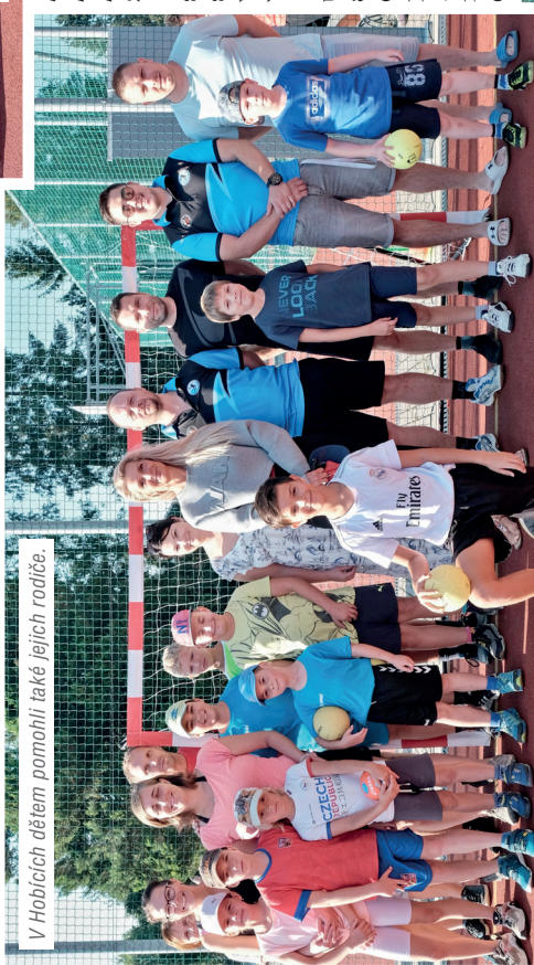
V Hobicích dětem pomohli také jejich rodiče

Kategorie B – Handbalisti byla obsazena pěti družstvy, která utvořila mladší a starší žáci z oddílu házené a žáci ze šestého a sedmého ročníku ZŠ Pod Skaalkou. V turnajové tabulce si to družstva rozdala v systému každý s každým na dvou hracích plochách. Nejtěžší to měli ti nejmenší Rockmeni, kteří obsadili 5. místo. Před nimi skončili Podskaláci ze 7. A a 7. B. Na druhém místě Bombardéři – kluci ze starších žáků a první místo patřilo dalšímu klubovému družstvu – Rebelům.