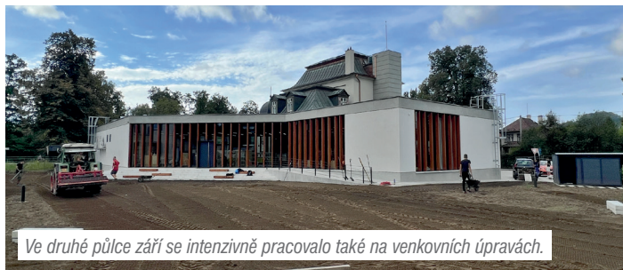
Ve druhé půlce září se intenzivně pracovalo také na venkovních úpravách.

Pokud se rozhodnete toto pozvání přijmout a vstoupit dveřmi do knihovny, budeme moc zvědaví, jak na vás barevná kombinace, kterou