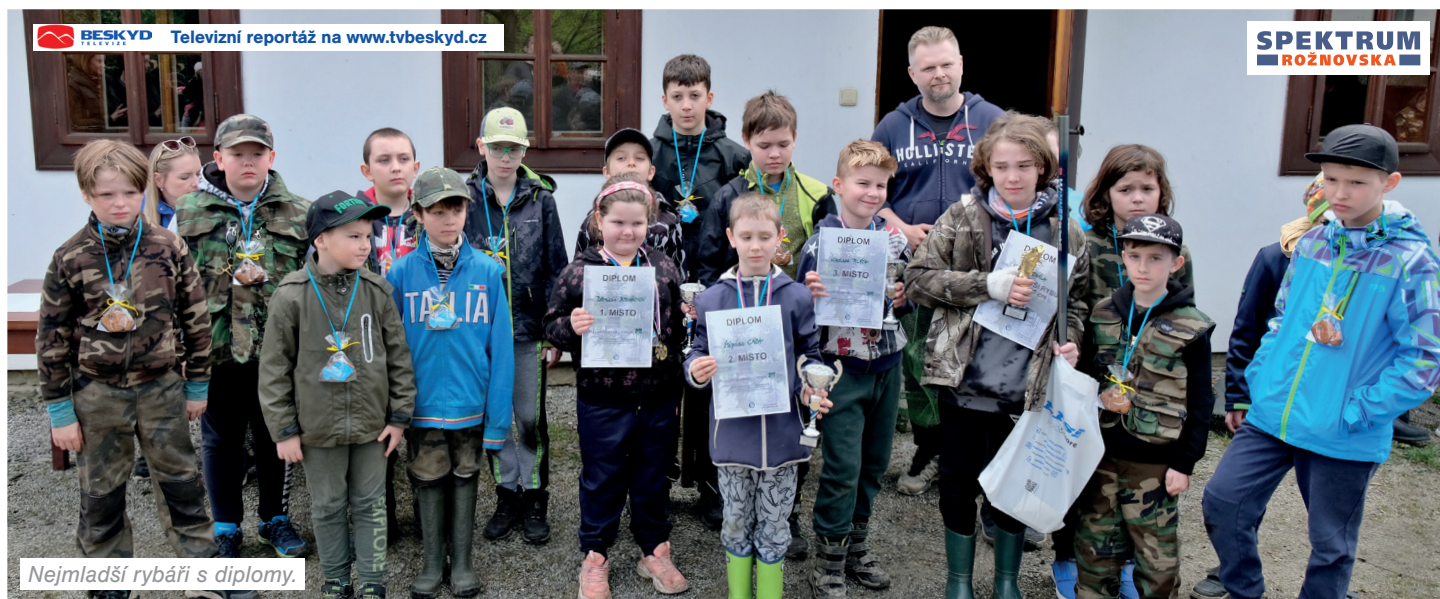
Nejmladší rybáři s diplomy.