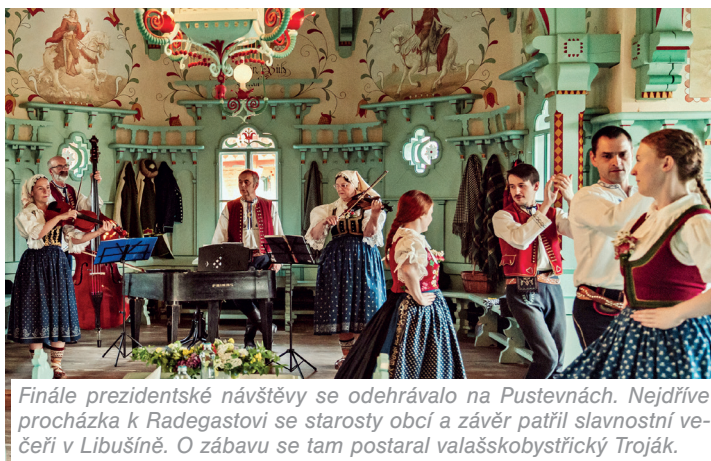
Finále prezidentské návštěvy se odehrávalo na Pustevnách. Nejdříve procházka k Radegastovi se starosty obcí a závěr patřil slavnostní večeři v Libušíně. O zábavu se tam postaral valaškobystřický Troják.