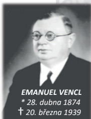
EMANUEL VENCL * 28. dubna 1874 † 20. března 1939

K 150. VÝROČÍ NAROZENÍ ZAKLADATELE ŠKOLY EMANUELA VENCLA, KTERÝ SE BUDE KONAT DNE: