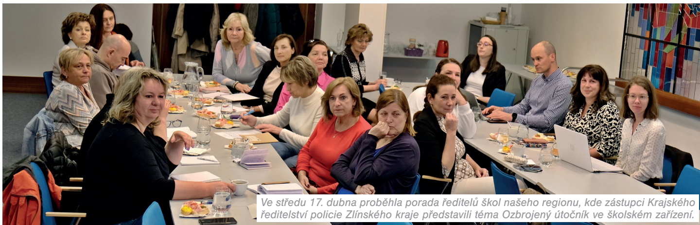
Ve středu 17. dubna proběhla porada ředitelů škol našeho regionu, kde zástupci Krajského ředitelství policie Zlínského kraje představili téma Ozbrojený útočník ve školském zařízení.

Zabezpečit budovy školských zařízení proti vstupu nepovolaných osob, zajistit protipožární detekci pomocí citlivých čidel a v neposlední řadě vyřešit problematickou dopravní situaci u škol nejen v době „ranních špiček“. Tyto cíle si už před lety vytýčilo vedení rožnovské radnice.